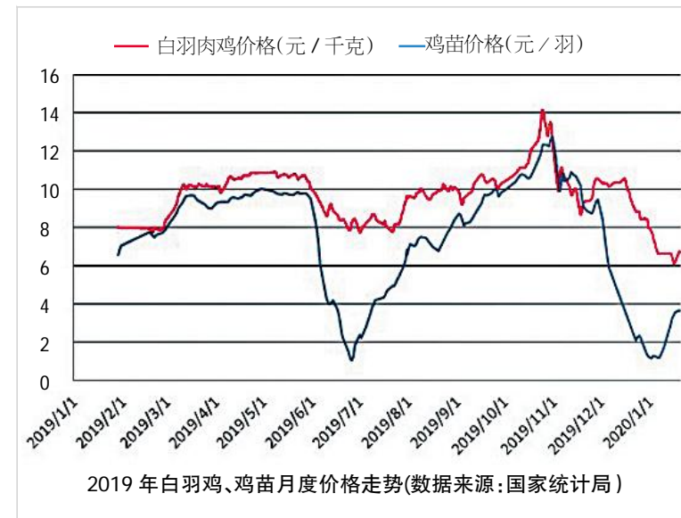
2019年白羽鸡、鸡苗月度价格走势

考虑二元能繁母猪和三元母猪的生产效率差异,预计2020年2至5月仍为猪肉供给极度紧缺的时期。由于前期能繁母猪快速下降导致的出栏下滑,预计会在4至5月带来猪肉供给的进一步下降,2020年三季度或开始缓解。2019年生猪销售均价在18-20元/kg左右,预计2020年生猪均价有望达到28-30元/kg左右,2020年企业业绩依旧处于兑现期。后期影响猪价走势核心因素仍为非洲猪瘟疫情发展趋势,前期补栏较早的区域,东北、河南、山东,疫情尚未完全平静,后续仍需持续跟踪补栏进展。