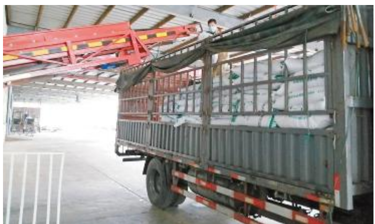
华中二区武汉通威为复工复产作好全面准备

今,公司高度重视员工人身安全,同时鼓励生产员工“保质量、增产量”,一人多岗,加班加点完成生产任务,有力保障生产线和销售线的正常有序运行。尤其在人员不足的情况下,生产系统分工合作、全员每天奋战14小时,并抽调机电工、膨化工每天参与装卸工作,展现了通威人优良工作作风。“不让一人感染、不让一人断料、抢春行动争创一流”天门通威在行动!