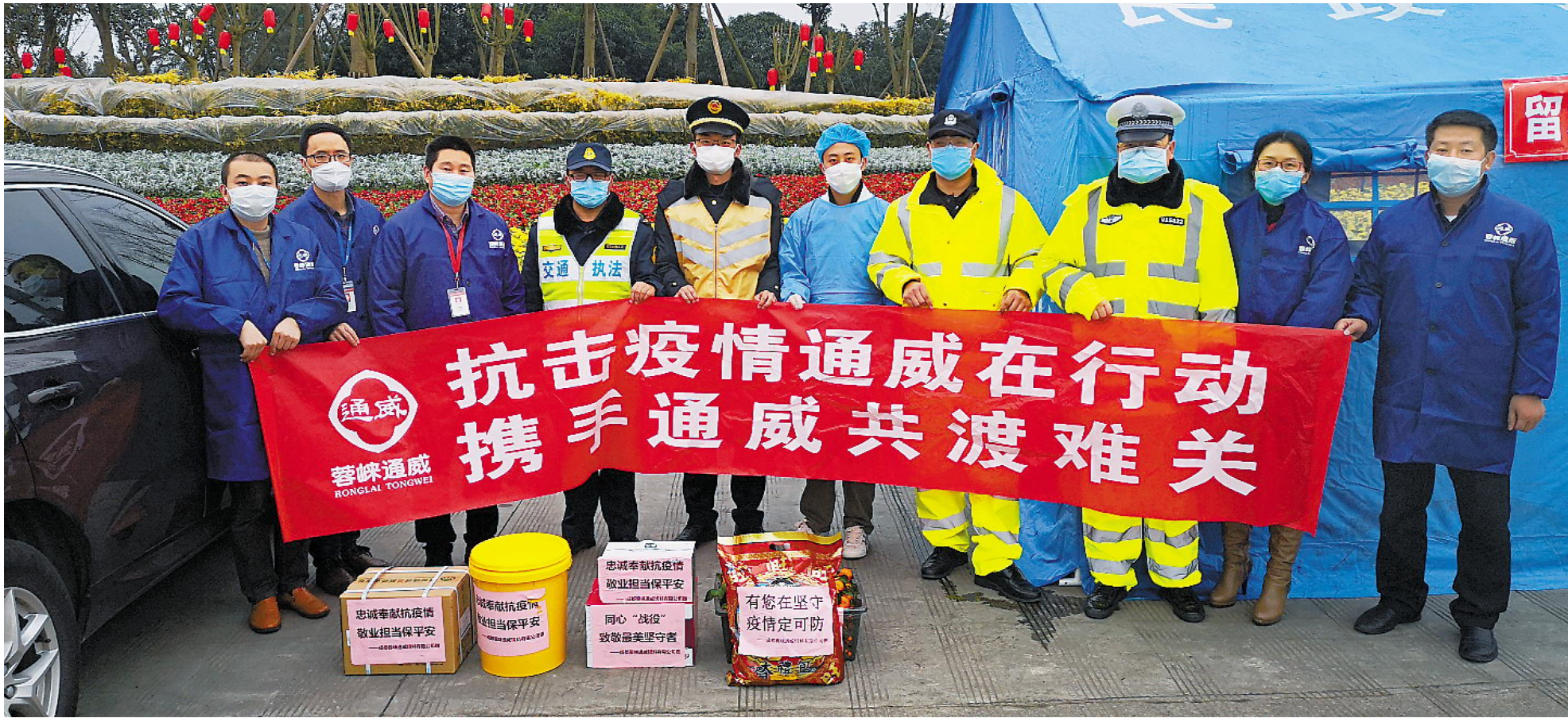
华西片区蓉峰通威慰问坚守疫情防控一线工作人员