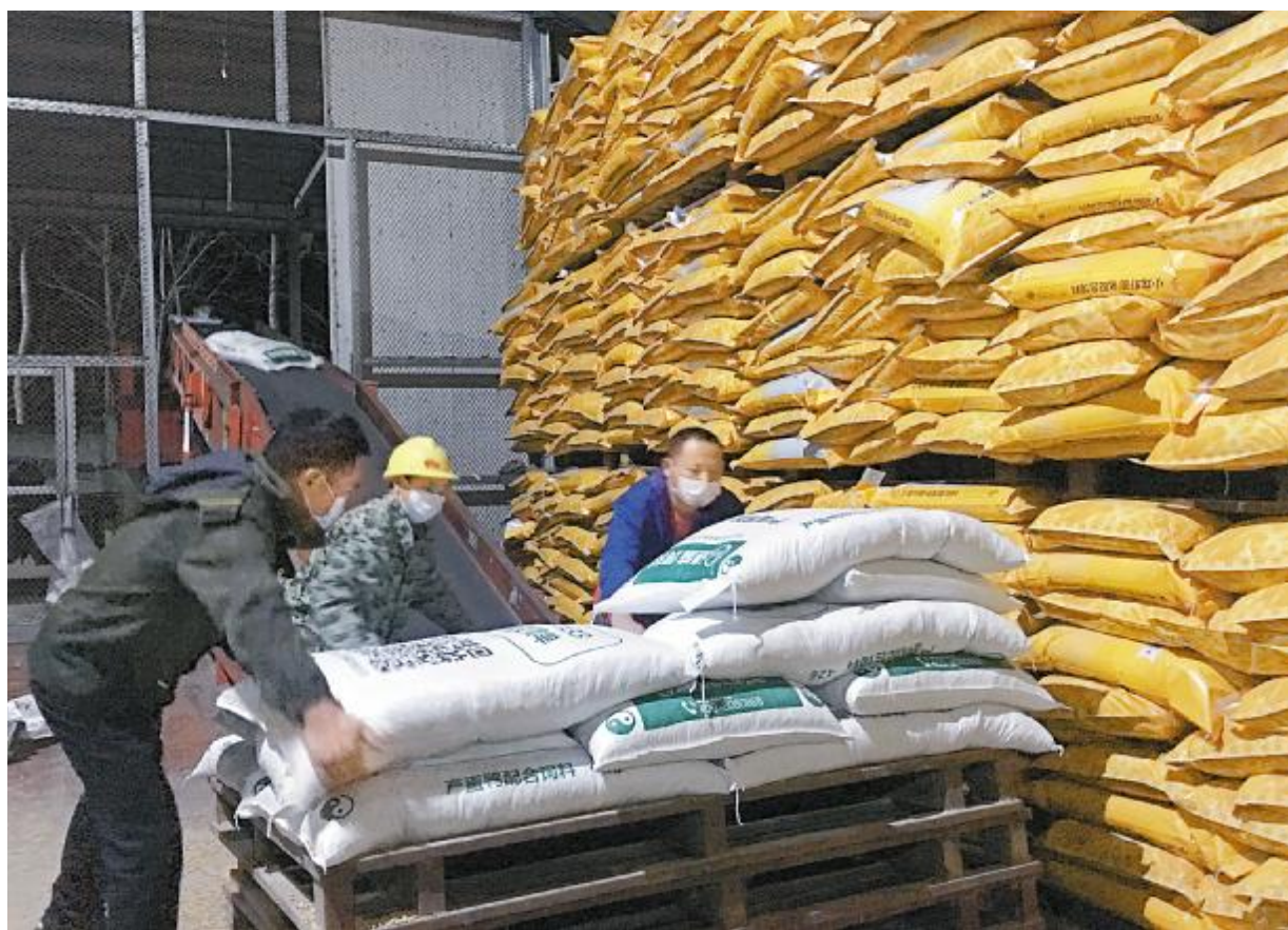
原料体系疫情期间为市场一线的抢春工作保驾护航