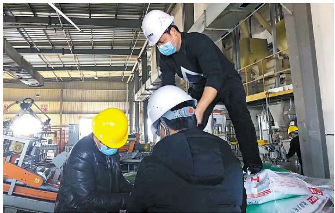
复工复产后,各分、子公司业务员及管理团队在生产一线协助生产和装卸

许多乡镇、农村区域都面临了封村、交通管制等问题,市场工作遇到了前所未有的困难,广东通威全体营销将士攻坚克难,通过线上沟通、线下拜访等形式积极推进市场开发和稳定工作,抢占市场先机,与客户共同渡过疫情难关。同时,广东通威各营销团队在线上积极开展培训工作,坚持每晚召开工作总结会,分享工作心得,为今春市场工作开展奠定坚实基础!