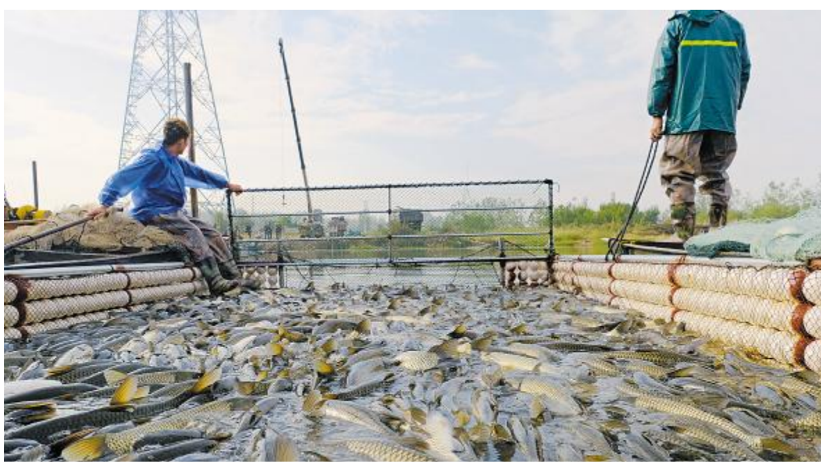
做好开春养殖管理,为全年养殖打下坚实基础

要做到早出鱼,必须做好当前养殖管理。其中主要包括以下两大关键点:1.恢复鱼消化功能,使用通威底改料,连用5天一个疗程,恢复鱼类的肝、胆、肠道等消化器官功能和提高鱼类体质。2.改底:使用通威底改(4亩/袋)改良底质,预防寄生虫、真菌、细菌等疫病。