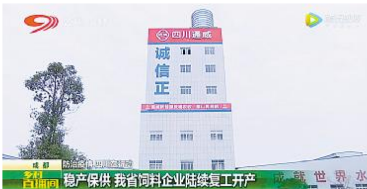
四川电视台《乡村直播间》栏目报道四川通威复工复产

施、生产经营情况进行了详细介绍,并对天门市各级领导的大力支持表示感谢。李总表示,天门通威将继续把员工健康安全放在首位,继续加强防疫工作,严格落实各项防控措施,齐心协力开展生产经营。相信在地方政府、工业园区领导的关怀和支持下,公司也一定能战胜这场疫情,保持良好的发展势头,用良好的经营结果来回馈员工、回馈社会。