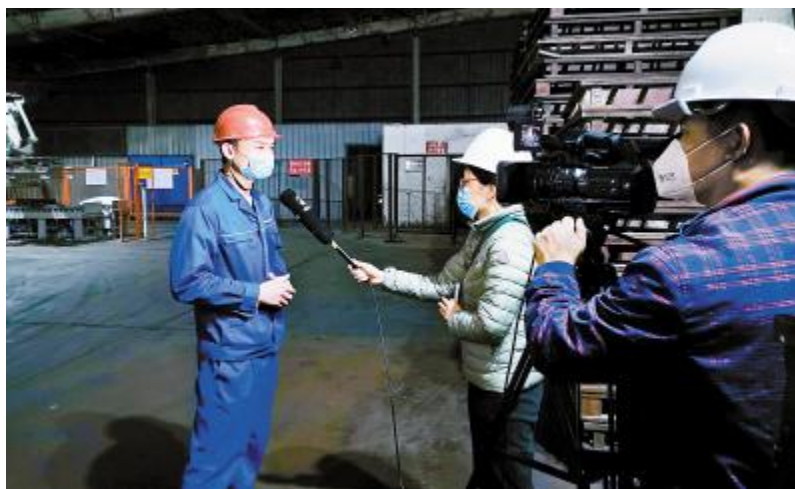
主流权威媒体聚焦通威股份农牧板块各分、子公司有序复工复产