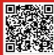
通威农牧资讯订阅号