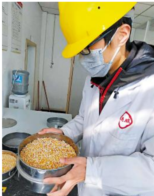
各分、子公司积极完成原料采购与储备

日独自前往市交通厅及防控中心办理车辆通行证,帮助市场部成功打通运输渠道。截至2月12日,已调料800余吨。四川通威2月2日率先开机,开足马力保障市场需求,但由于编织袋供应非常困难,个别品种出现缺货现象。编织袋生产企业属于人员密集型企业,开工时间一再推迟,严重影响饲料成品运输。公司迅速决策,立即召开市场、生产、采购沟通会议,在得到客户的理解与支持后,最终决定用部分通用包装袋应急。华西区采购总监与生产总监亲自带队下库房,组织部门在岗员工标注相关信息,当日处理编织袋约5000条,及时满足市场需求。