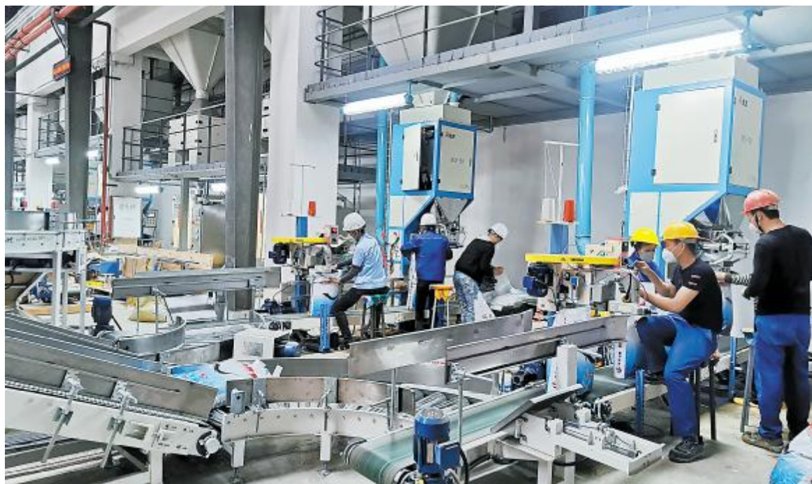
通威股份虾饲料片区阳江海宴正式复产

春节放假期间,通威旗下部分饲料企业已紧急组织当地员工返岗开机试生产。2月2日,通威股份根据企业实际情况,建立三级防疫工作体系,各级指挥部落实各项防控措施,全力协调新冠疫情应急处置工作,为复产经营做好准备。2月3日,通威股份管理总部及全国范围分、子公司正式复工,在确保员工生命健康安全的基础上,为保障终端养殖积极创造条件,为后续复产保供奠定坚实基础。四川通威2月2