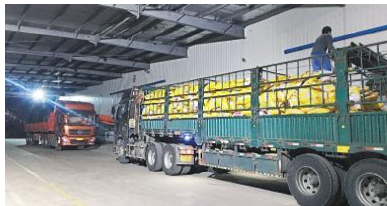
各兄弟公司积极协调,全面保障各地分、子公司原料供应

的经济价值”。为解决人员到岗与跨区域运输这两大阻碍复工的难题,2月2日起,原料体系开始跟进人员到岗情况,与生产、品管、市场、配方等多方配合。在迅速调整采购策略,理清总部、战区、分子公司的保障分工,并解决了货源、物流、调料需求信息的跟踪传递后,“不让经营者操心”的目标已达成大半。