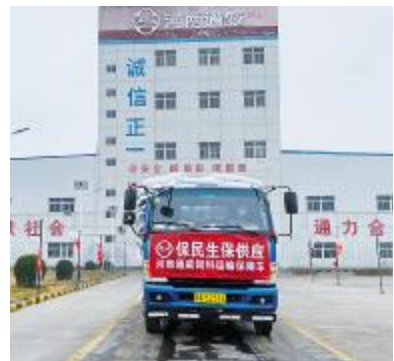
河南通威饲料运输保障车出厂

真菌毒素是真菌在食品或饲料里生长所产生的代谢产物,对人类和动物都有极大危害。防止真菌毒素危害,首先要防止食物和饲料霉变。2008年以来,威尔检测先后组织参加了200余批次FAPAS、LGC、CNAS、国家认监委、四川省市场监督管理局和四川省农业厅等相关部门组织的能力验证,通过率位居行业前列。