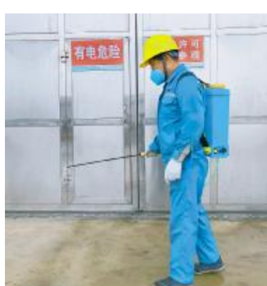
各分、子公司按时对生产区域进行全方位消杀

同时在生产方面,公司全力组织人员到岗生产,保障生产工作顺利开展。市场部与生产部实时沟通,保障产品供应。后勤部门日夜关注业务动态,积极跟进疫情防控专用车辆通行证办理,全力协助客户将疫情带来的不利影响降到最低。绍兴通威全员齐心协力确保饲料安全供应,携手合作伙伴打赢疫情防控攻坚战,为社会经济发展做出更大的贡献!