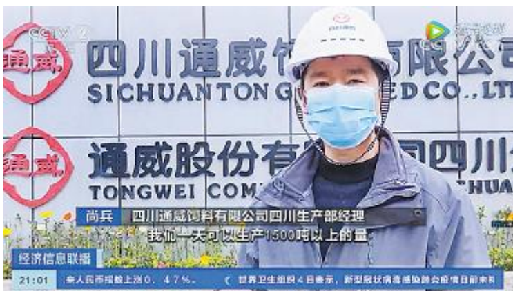
央视二套《经济信息联播》栏目采访四川通威生产负责人

文中展示海南通威生产车间有序生产场景,并称公司在严防非冠疫情的同时,千方百计开工生产以满足养殖户用料需求。据了解,海南通威于2020年1月31日下午正式开机生产,8条生产线开足马力。在公司的紧急组织下,70%以上的员工加班留岗,使得企业生产产能达到额定产能的90%以上,日生产猪料、鱼料、禽料1200吨以上,产品品种达80余个。