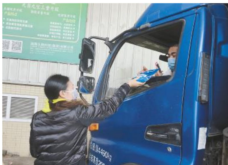
茂名通威向客户免费赠送水产动保产品“通威速消”解决消毒液短缺问题