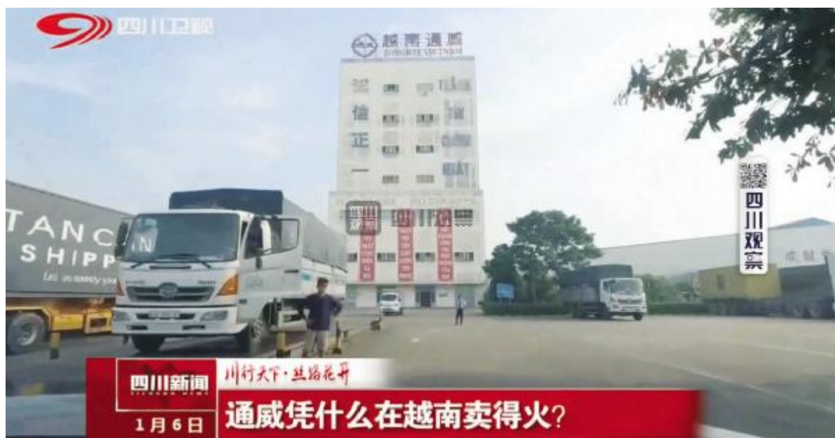
四川卫视《四川新闻》栏目聚焦越南通威

四川从西部内陆省份走向开放前沿,“一带一路”建设是重大机遇。1月6日晚,四川卫视《四川新闻》栏目推出《川行天下·丝路花开——走进越南通威》专题报道,围绕通威海外发展情况、产品与服务、公司竞争优势、给川企带来的启示等话题进行了深度解读,全面展示了通威作为川企走出国门、进军“一带一路”国家杰出代表的良好企业形象,探寻川企投资“走出去”的全新机遇。