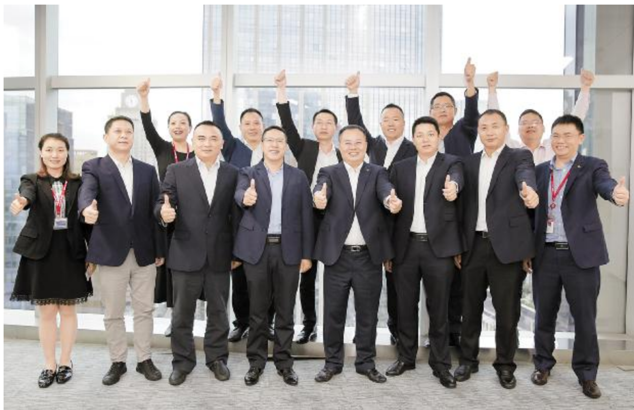
通威股份农牧板块打造“高质量内生增长”发展里程碑

各片区及分、子公司不断刷新历史销量纪录,捍卫区域霸主地位:虾饲料片区2019年片区销量同比增长55%,珠海海壹、湛江海壹成为珠三角特种料市场的新主角;华南一区水产料增长近30%,连续两年水产料销量增量第一,为片区在2020年兑现水产料三年销量翻番的目标打下坚实基础;华南二区水产料增速远超竞争对手,继续称霸粤闽市场;华中一区保持连续三年的快速增长,南昌通威单厂规模取得重大突破,合肥通威特种料跨越式发展;华中二区销量持续5年增长,小龙虾料迎来同比190%的爆发式增长;华东片区水产增长20%,领先华东同行,无锡通威特种料全年零库存的前提下实现了量利双增;华西片区在非瘟不利影响下,禽料同比增长110%;华北二区全力开拓市场,猪料逆势同比增长20%;海外片区水产料绝对增量和增长率均位列股份农牧第一,量利均创片区历史新高……全体通威人上下一心、下沉终端、攻坚克难,奋力开启高速发展的强大引擎。