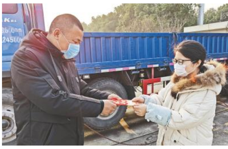
无锡通威工作人员为新年第一位客户送上“开门红”

也许所有人都已习惯他们的勤劳与默默无闻,但是在人人自保的灾祸面前,农牧人步履不停,保障万千养殖户的刚需,守住居家隔离的基本防线。通威股份国内各片区,各分、子公司,以及数万名员工与不计其数的客户,都成为默默无闻的守护者。他们用特殊时期的坚守,保障千家万户食品供应,协助控制疫情,更为稳定国人未来的“菜篮子”贡献着磅礴的力量!