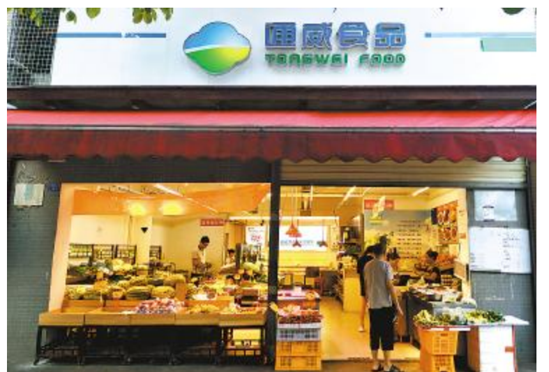
通威股份食品板块聚焦市场,取得历史性利润突破

专注和聚焦管理的要求,对各子公司的业务模式进行全面梳理,明确业务范围和经营模式,并按照效率优先的原则对板块内部业务进行梳理和整合,食品事业部完成了通威食品历史性的利润突破。食品板块各公司积极推动和落实变革,经营业务开展有效,工作亮点颇多。