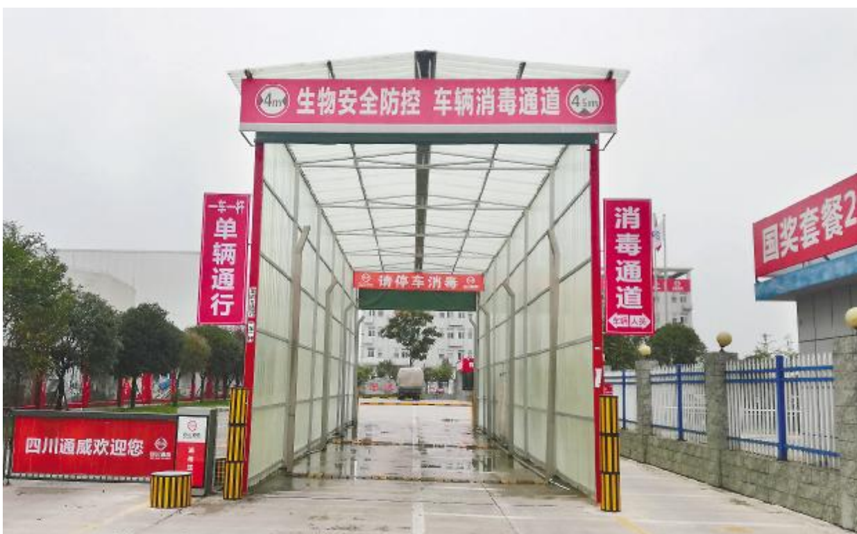
通威股份设施所研发的超声雾化灭菌系统对进入厂区的所有车辆进行全方位雾化消毒