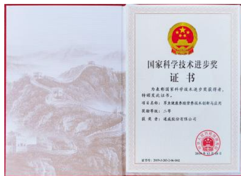
通威股份再次荣获2019年度国家科学技术进步奖二等奖

通威在淡水鱼饲料上的科技研发和成果转化优势,为实现通威“为了生活更美好”的美好愿景和打造世界级健康安全食品供应商的宏大目标作出更大贡献。