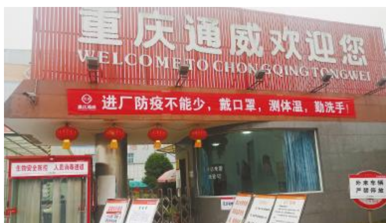
重庆通威在大门处设置防疫通道

销,由关系营销转型为价值营销,“营销三变”正成为通威股份一线市场人员的工作常态。大家通过线上办公维护和巩固已经开发的客户,通过社群展开养殖服务,实时发布鱼价行情、养殖技术要点、开展疾病咨询,以社群有效性满足当前阶段性养殖需求。同时,为防止病毒交叉感染,目前通威股份各公司建议用户使用通威一点通网上订货系统,通过饲料在线订商城从网上下单,减少疫情传播风险。