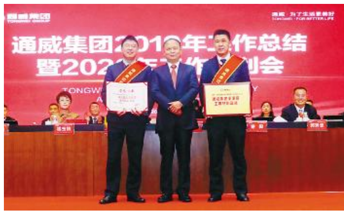
无锡通威生物科技有限公司特种料分公司荣获董事局主席特别嘉奖