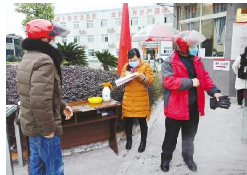
重庆通威管理团队轮流为员工、司机朋友量体温、登记信息