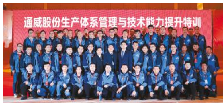
通威股份生产体系管理与技术能力提升培训合影

同时,各体系结合水产养殖总体规划及2019年复盘情况,梳理未来发展方向和2020年具体目标以及实