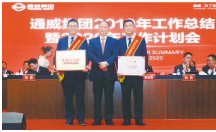
通威股份总部水产市场部荣获董事局主席特别嘉奖