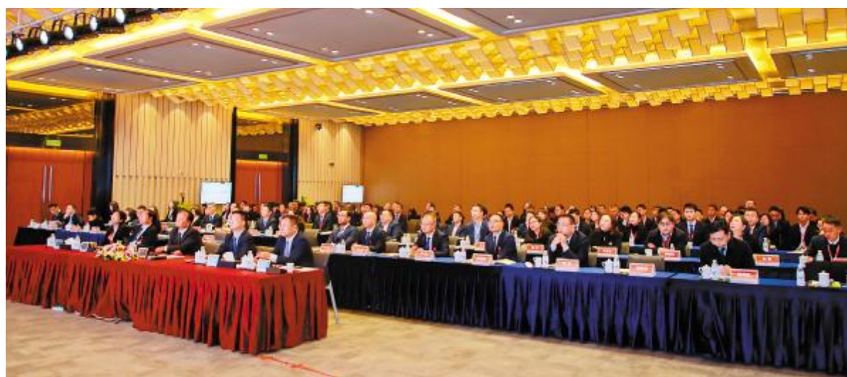
通威股份管理总部 2019 年度述职会隆重举行