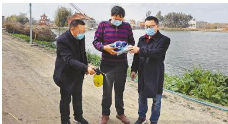
昆明通威为客户提供口罩和“通威速消”

件,全面复工复产。同时,会上现场讨论形成防疫期间有关厂区管理防控、市场营销及舆论管控工作规范,建立各系统疫情防控体系,并由信息部搭建疫情防控措施点检系统工具,便于各公司人事行政部负责每天17:30前通过FBC反馈员工到岗、人员及车辆进出管理、环境卫生管理、防疫物资、复工复产等情况点检信息。另一方面,结合疫病特点和公司自有产品生产情况,通威三新药业及设施渔业工程研究所发布防控2019-nCoV消毒应用指南和饲料厂区防疫解决方案,加强饲料企业消毒防疫,对进厂车辆、人员等全面消毒,为后续稳产保供奠定坚实基础。