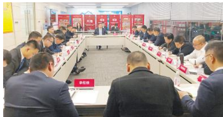
通威股份农牧板块新任总经理座谈会现场