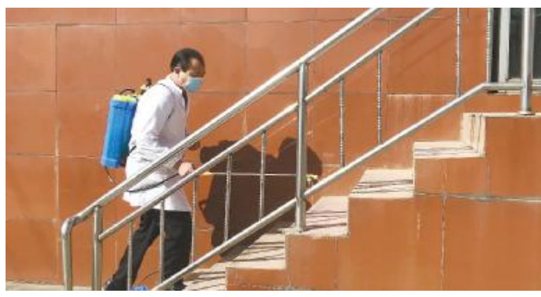
工作人员对生产厂区进行全方位消杀