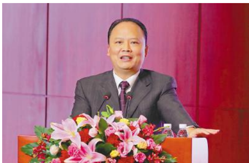
刘汉元主席在会上作重要指示